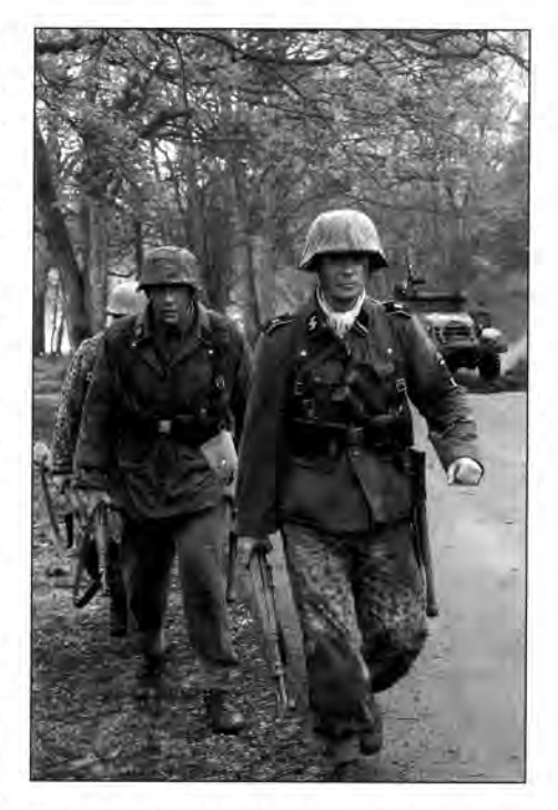
Die "Second Battle Group" nimmt an zahlreichen öffentlichen und privaten Veranstaltungen teil, darunter an den größten Reenactment-Veranstaltun-

Da die Darsteller der "Second Battle Group" so bemüht um sorgfältige, geschichtlich korrekte Darstellung der deutschen Soldaten sind, wurden sie auch wiederholt als Mitwirkende in Spiel- und Dokumentarfilmen eingeladen. Seit den 1990er Jahren sind wir in zahlreichen Filmen über den 2. Weltkrieg auf verschiedenen briti-